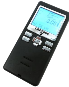
Shot Timer (Anexo 1, Fig. 02)