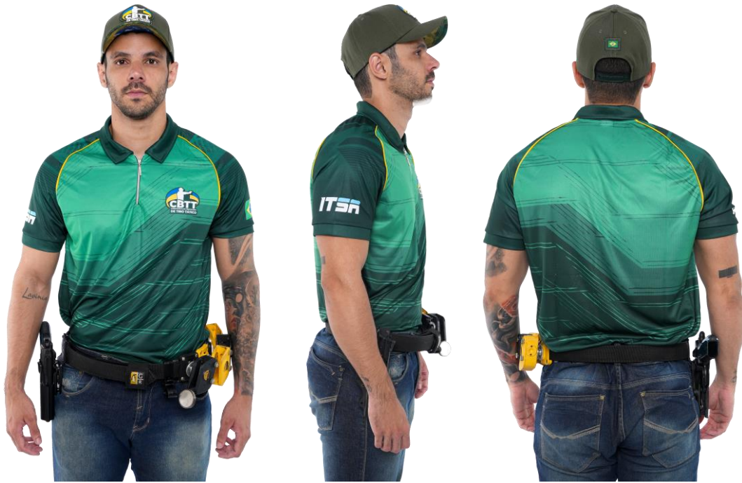
Posição Inicial de Arma Curta (Anexo 1, Fig. 06)