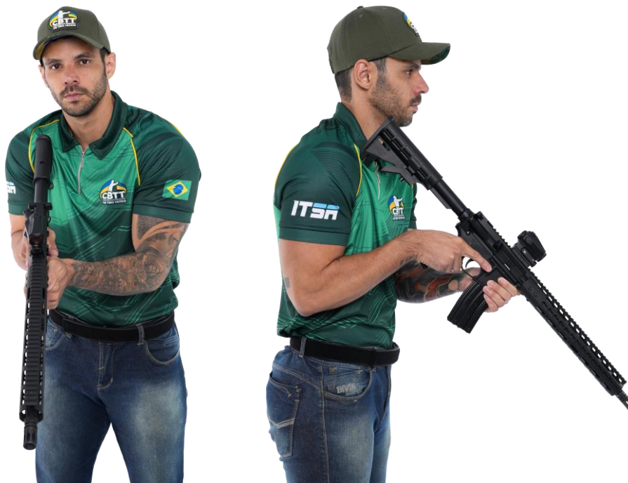
Posição Inicial de Arma Longa (Anexo 1, Fig. 07)